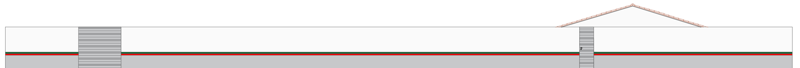
FACHADA ESC: 1/100